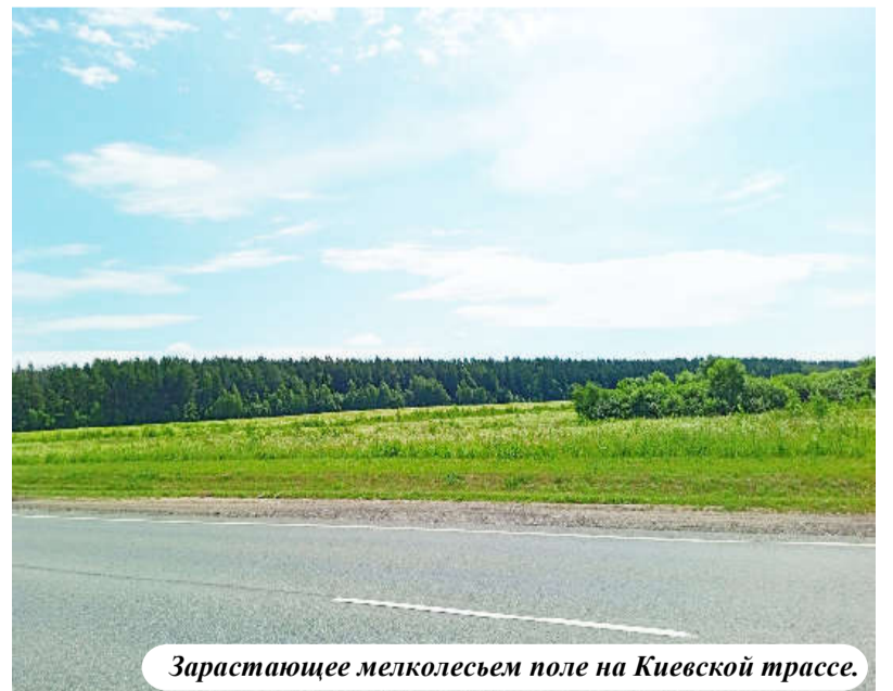
Зарастающее мелколесьем поле на Киевской трассе.