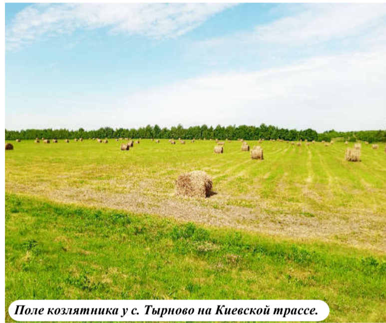
Поле козлятника у с. Тырново на Киевской трассе.

варяги, в головах которых уже тогда даже мысли не было, что на этой земле они будут работать. Но ведь вдоль тех же трасс подобные участки во владении